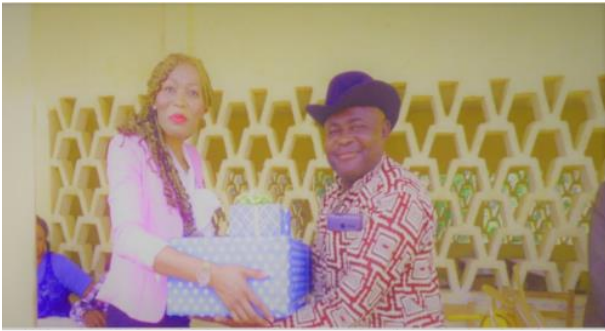
Die Chairwoman spendete Schulmaterial für das Lycée-Management, Geschenke an die besten Lehrer