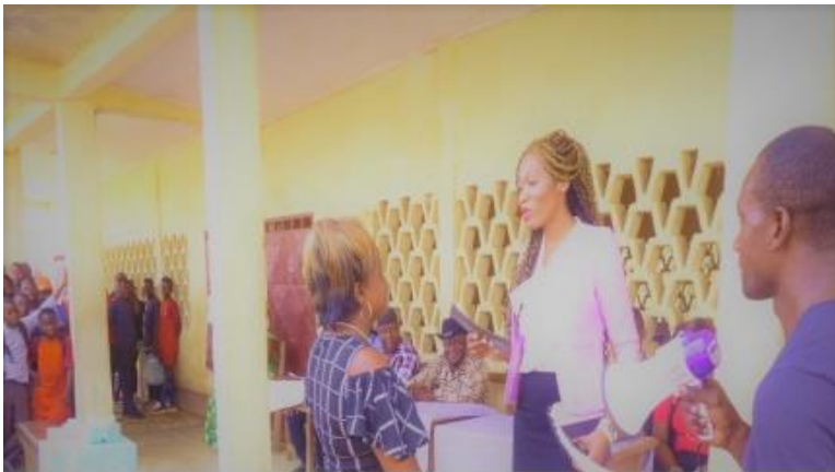
CEO der AAA Intergalactic Prinzessin Belle verteilte Geldgeschenke an die besten Professoren in Afrika.

Die AAA Intergalactic Stipendien sind daher nicht nur eine „nette Geste“. Sie sind wichtige Investitionen, um Studenten, vor allem jungen Frauen und verschiedenen Weltregionen dabei zu helfen, die Armut abzuwenden.