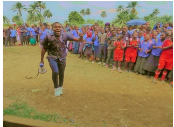
Die Schüler waren begeistert und haben spontan gesungen, um Prinzessin Belle zu danken.

Nachdem der Direktor des Gymnasiums und die Studenten sich herzlich bei der Prinzessin Belle bedankten, vernetzte sie sich mit den Führern des Landes, um sich für die Schaffung lokaler Arbeitsplätze und die Einführung des Investitionssystems: „Gerechte Finanzierung“ der AAA Intergalactic einzusetzen. Prinzessin Belle, Vorstandsvorsitzende, sagte mit all ihrer Konzentration, ihrem Kampf- und ihrem Siegergeist: „Wir müssen erst Tausende von Arbeitsplätzen schaffen, dann werde ich mich freuen!“